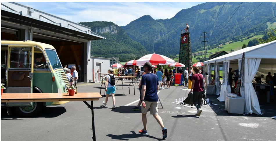
Festgelände am Wochenende vom 24. und 25. Juni 2022.

Der Anlass darf rückblickend als voller Erfolg betrachtet werden. Er war ein Volksfest mit über 2'000 Besuchenden.