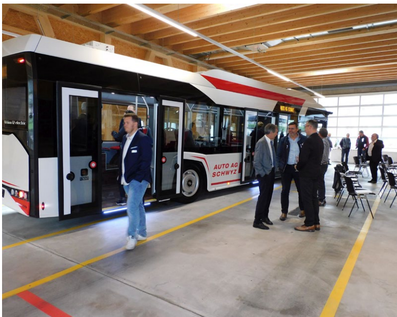
Bestelleranlass 2022 mit dem neuen Solaris Urbino electro.