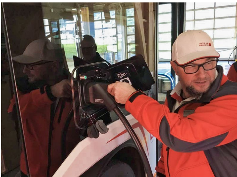
Im Rahmen des CZV-Kurses wurde die Ladung des Solaris Urbino electric getestet.

Im Berichtsjahr wurden die Kurse in Zusammenarbeit mit der Verkehrsfachschule Schweiz AG geplant und durchgeführt. An insgesamt 16 Kurs-tagen konnten die Teilnehmenden den neuen Solaris Urbino electric auf Herz und Nieren testen.